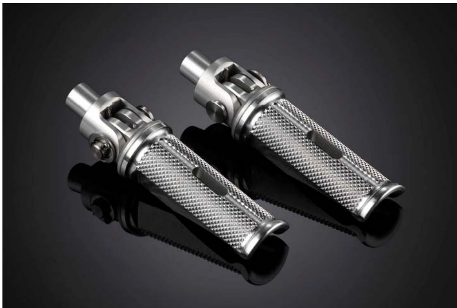
Ausführung Fußraste klappbar halbrund