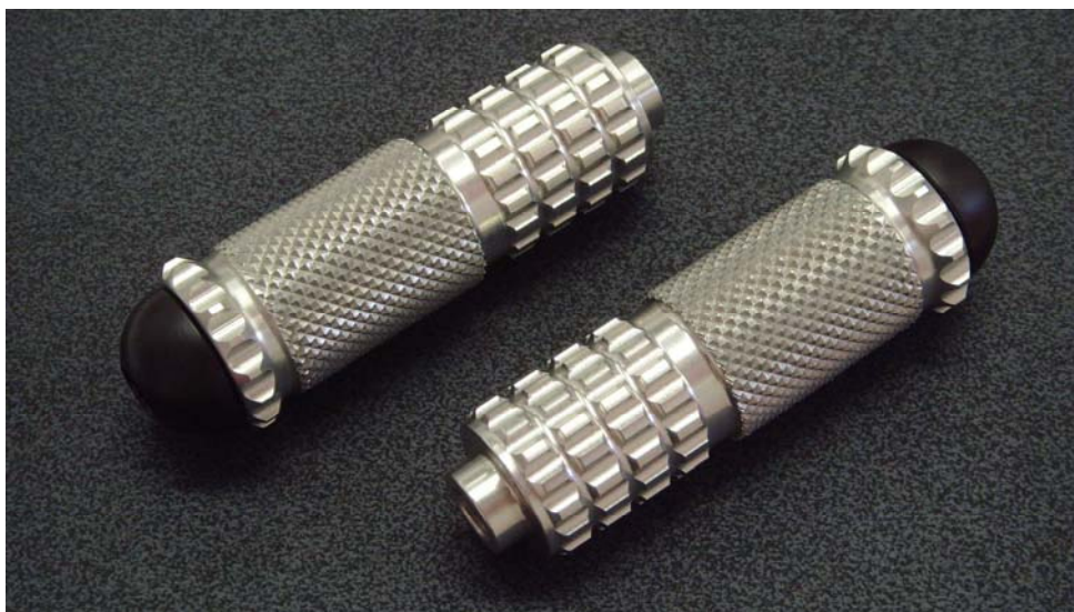
Ausführung Fußraste starr rund