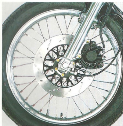
Die packt zu: 275 mm-Scheibenbremse.

Das Problem mit der Schwungmasse ist bekannt: Im unteren Drehzahlbe- reich hat man nie genug und oben raus wünscht man sie zum Teuf... So klar wie das Problem, so einfach ist bei der GR 650 X die Lösung: Stich- wort variable Schwungmasse, d. h. die Schwungmasse der Kurbelwelle ist geteilt. Bis ca. 2.500 Umdrehungen steht die volle Masse mit sattem Dreh- moment zur Verfügung. Darüber wird sie per Fliehkraft abgekoppelt: Der Motor wird ungemein agil und lauf- rig und reagiert spontan auf jede Bewegung des Gasgriffs.