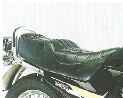
Straffe Polsterung und „englische Sitzhal- tung“: Echte Entspannung statt schmerzhafter Verspannung.

Wer jemals die „englische Sitzhaltung“ genießen durfte, der weiß, was man bei der GR 650 X unter angenehmer Sitzposition für Fahrer und Beifahrer versteht: Breite Sitzbank, entspannter Kniewinkel und guter Maschinenkon- takt. So verwöhnt läßt sich auf Touren das genießen, was andere links liegen lassen (müssen): Land und Leute.