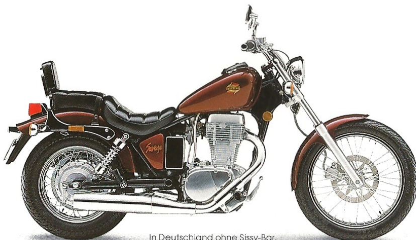
In Deutschland ohne Sissy-Bar.

3000 Umdrehungen ergeben eine sagenhafte Durchzugskraft. Satte Leistung, die durch die zeitgemäße Motorenteknik immer problemlos zur Verfügung steht. Vor Problemen mit der Technik schützt zudem der E-Starter: Ein Knopfdruck genügt. Beeindruckend auch das Fahrwerk der Savage: Knapp 1,5 Meter Radstand, 19" Vorderrad und besonders tiefer Sitz. Nur 70 cm trennen den Fahrer vom Asphalt. Die Idealmaße eines Custom-Bikes dieser Klasse. Dazu die gediegene Ausstattung, in der sich die klare Linie konsequent fortsetzt. Kein Teil stört oder wirkt billig. Wohin man auch sieht, Plastiklösungen sucht man bei der LS 650 Savage vergebens. Bleibt im Grunde nur die eine Entscheidung zu fällen: Ob Sie die LS mit dem geschwungenen Hochlenker oder lieber mit dem markanten Flachlenker fahren wollen.